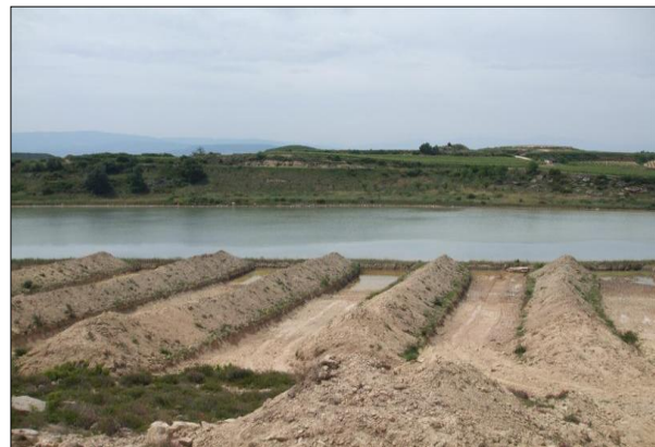
Imagen de los movimientos de tierra y excavaciones observadas en el litoral del lago en 2009