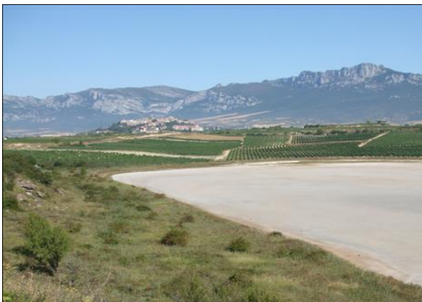
Imagen de los viñedos que rodean al lago