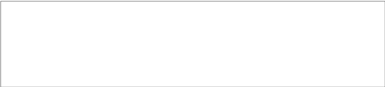
Vista de la zona litoral del lago a finales de verano de 2009