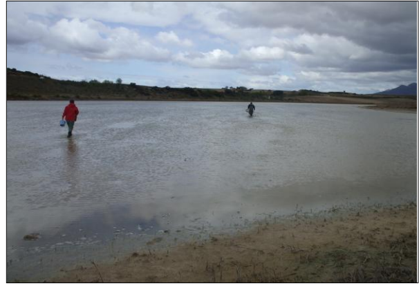
Imagen de la toma de muestras