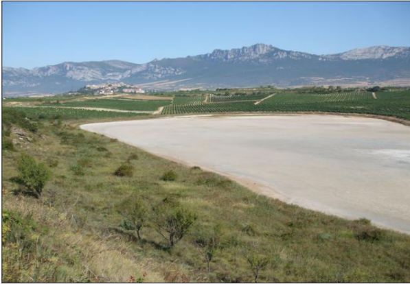
Vista de la zona litoral del lago a finales de verano de 2008